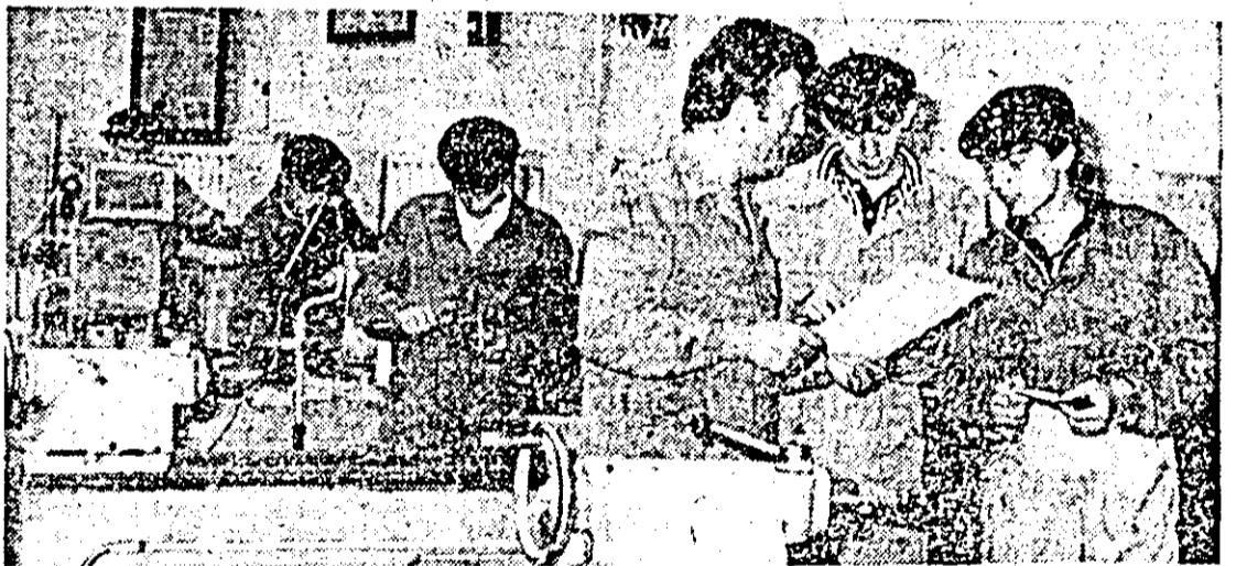
Oră de practică la Liceul Industrial nr. 1 Arad.

Echipele de handbal și baschet ale școlii au urcat de nenumărate ori pe podiumul de primierie, iar elevii școlii care practică sporturi individuale au obținut rezultate foarte bune în cadrul concursurilor la care participă.