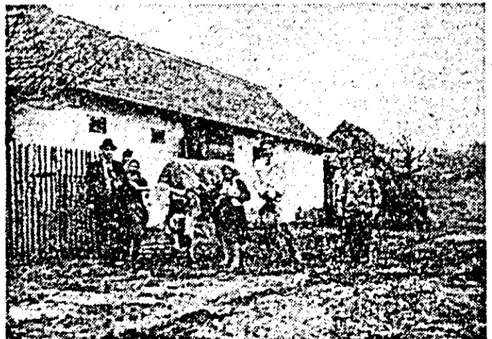
Instantaneu luat în laja unei gospodării țărănești din Văsoaia.

Firește, acestea sînt cîteva cazuri și, deci, nu putem generaliza. Dar, fiecare din ele ne îndreptățește să tragem un semnal de alarmă atît silviculturii, cit și zootehniei, deoarece, după cum s-a relevat în cadrul colocviului, extinderea silviculturii în interiorul patrimoniului de pășuni nu se datorează atît tendințelor silvice, cit mai ales neîngrijirii suprafețelor destinate zootehniei din zona montană.