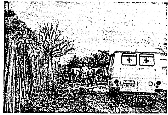
Prin grija Direcției sanitare a județului, dispensarul uman din Chișindia a fost dotat cu o salvare pentru o mai rapidă asistență medicală necesară locuitorilor satelor de munte de pe raza comunei. ÎN FOTOGRAFIE: salvarea a ajuns la timp în satul Văsoaia.