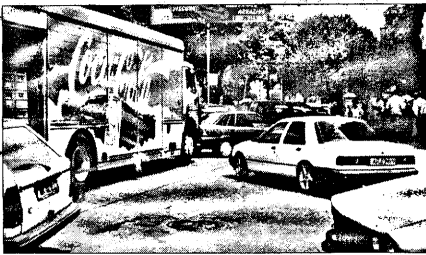
Harababura automobilistică pe B-dul Revoluției