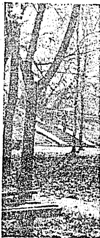
Ilustrație arădeană de sezon.