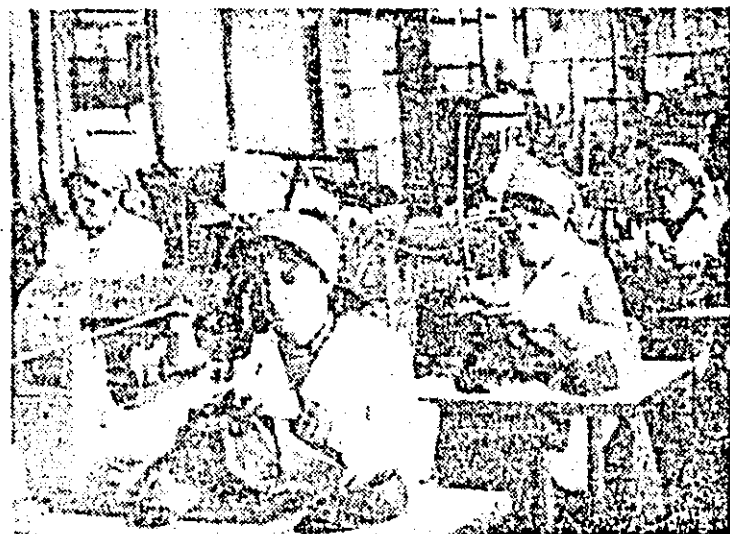
Aspect de muncă în atelierul pregătirii-cusut al întreprinderii „Libertatea” Arad.