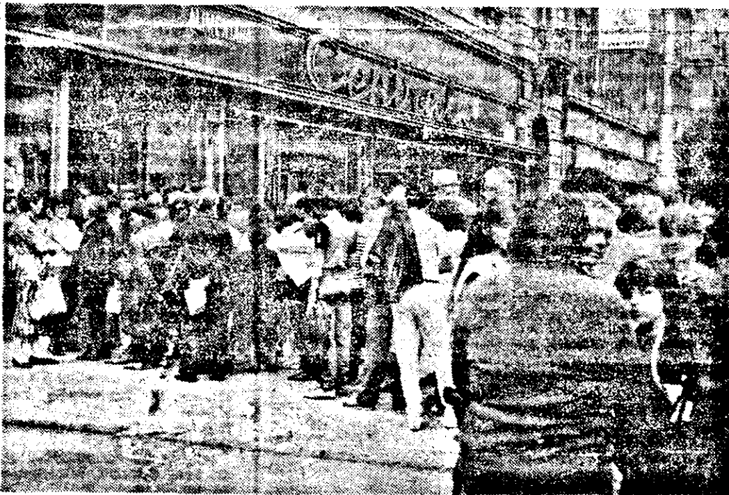
Alimentara nr. 130 „Central”: sâmbătă, 12 mai, la ora 15.30, câteva sute de oameni așteptau să vină pâinea.