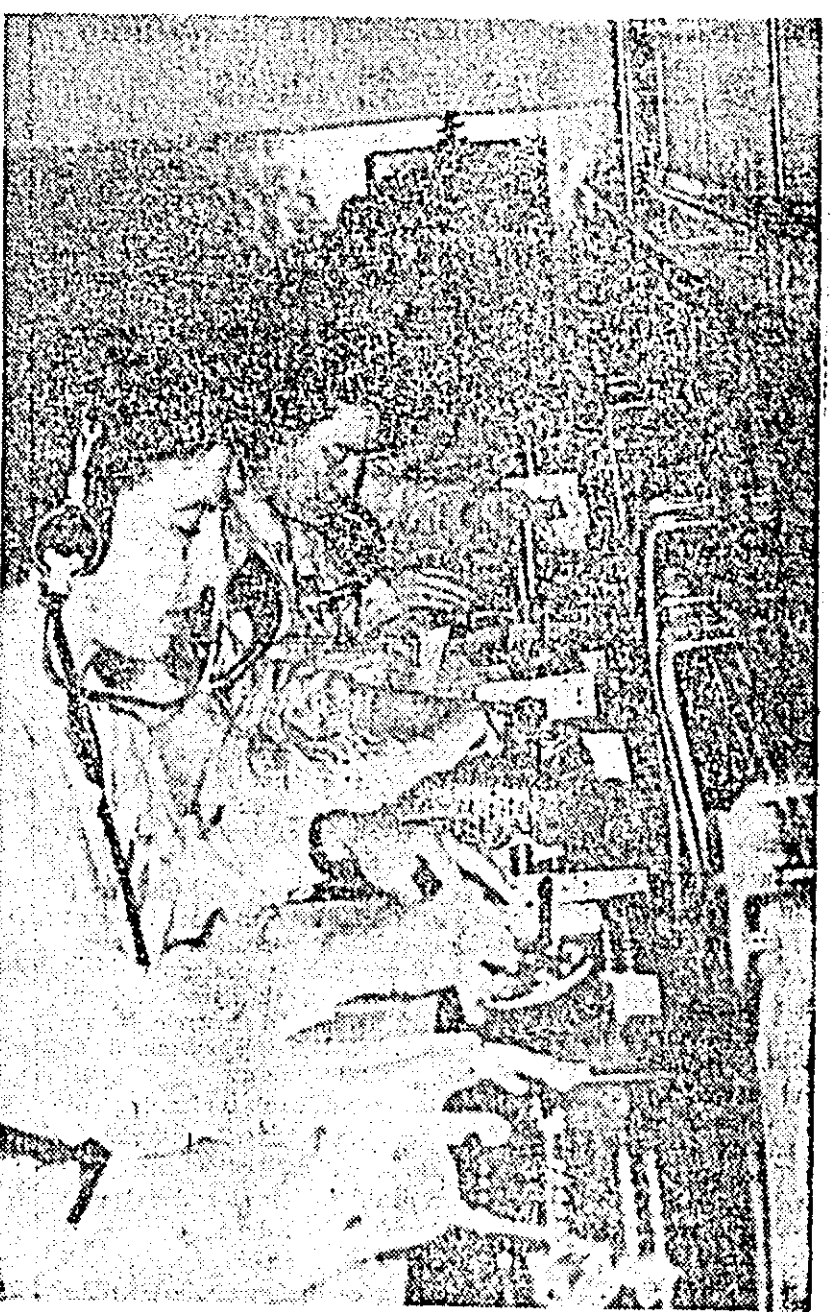
Legăturile telefonice funcționează ireproșabil. Lucrătorele de la puplul de comandă își fac datoria cu simț de răspundere, aducînd prin aceasta o contribuție însemnată la realizarea sarcinilor ce stau în fața Oficiului PTT Arad.

La 1 iunie, în fiecare an, se sărbătorește ziua internațională de apărare a copilului. În cinstea acestui eveniment comitetul raional al femeilor a luat o serie de măsuri încă de pe acum. Colectivul constituit în acest scop, din reprezentanți ai organelor locale UTM, sindicale și de stat, și-a întocmit un plan de muncă concret. În perioada ce urmează zilei de 1 iunie se preconizează o frumoasă acțiune destinată celor mici. Printre altele se vor organiza spectacole la sate ale teatrului (de păpuși din Arad, prezentarea de filme pentru copii, concursuri sportive, seri literare și de basm) în cadrul bibliotecilor, precum și alte activități specifice vârstei copiilor.