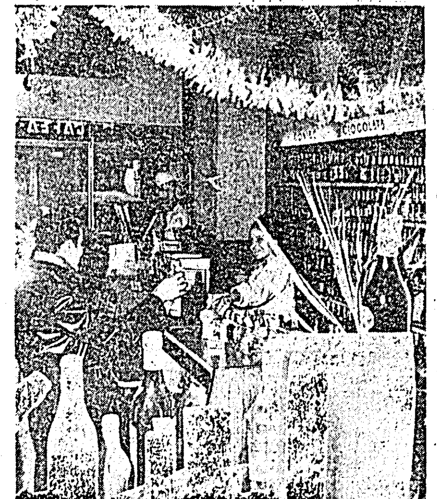
„Luna cadourilor”. Magazinele cunosc marea afliuență a cumpărătorilor dornici să ofere o surpriză plăcută celor dragi. În fotografie: un aspect din aceste zile la magazinul „Central” al O.C.I. „Alimentara”.

Clubul tineretului din orașul Chișineu Criș a organizat duminică o seară pentru tineret în cadrul căreia prof. Ioan Miron a ținut expunerea: „Tineretul și patriotismul socialist”. A rulat apoi filmul „Răsuna valesa”. Această acțiune s-a înscris în cadrul acțiunilor sărbătoririi majoratului, dovedindu-se de o reală reușită.