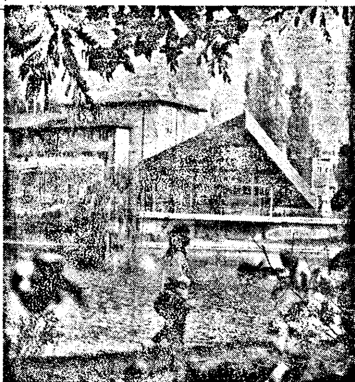
Era firziu și era toamnă...