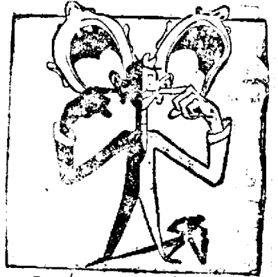
E MAI FOLOSITOR ȘI MAI CUMINTE SĂ-ȚI ASTUPI URECHILE LA VORBELILE VICLENE.

Majestatea Sa Regina mulțumește călduros tuturor aceluia, care vor răspunde la apelul său, contribuind la această operă prin darul lor.