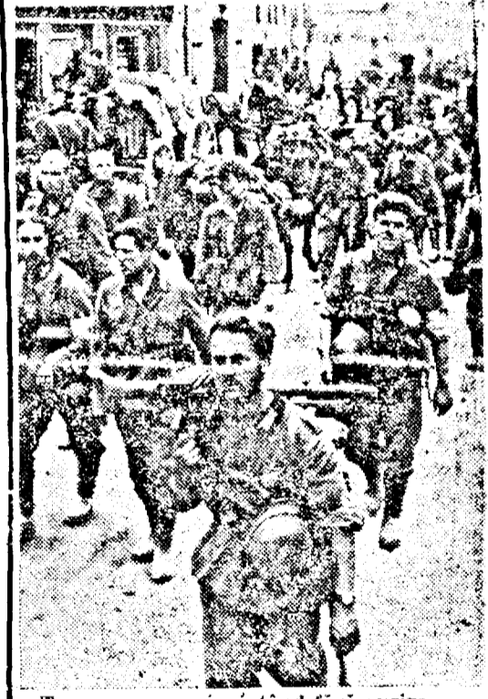
Trupe germane înaintând fără oprire