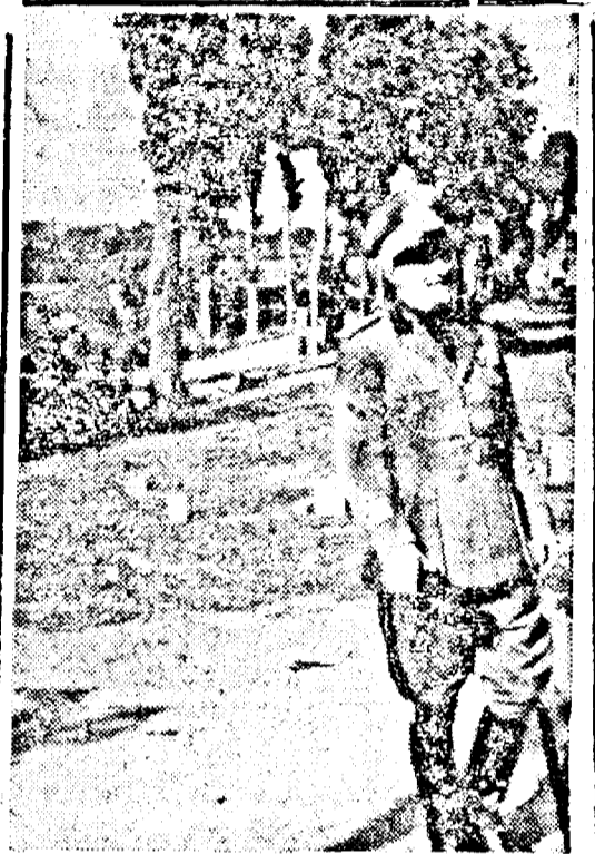
Generalul de armată italian Melchiori care a vizitat recent frontul german din occident.