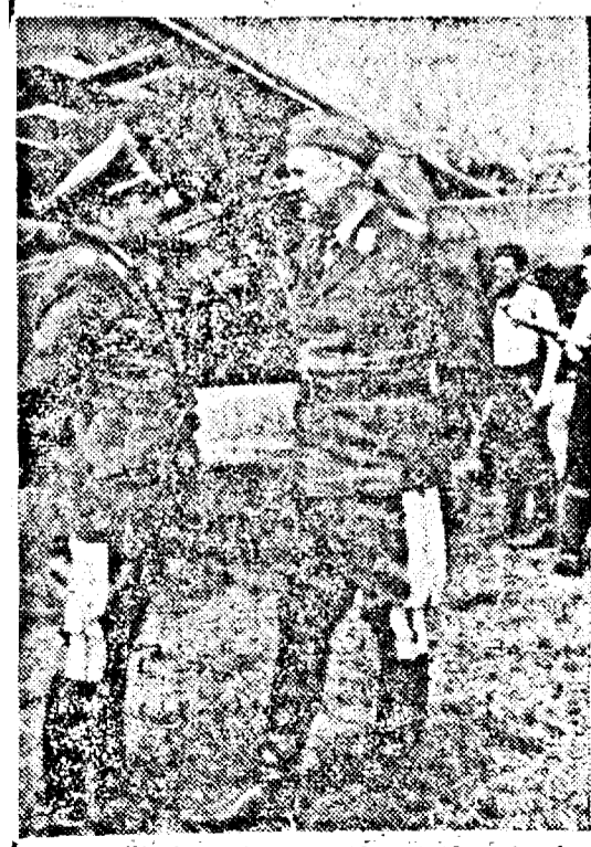
Generalii de aviație (stânga) și Loerzer conversând pe un aeroport belgian.