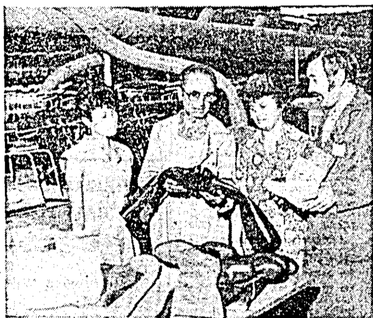
La Intreprinderea de încălziminte „Libertatea” se acordă o atenție deosebită calității produselor.