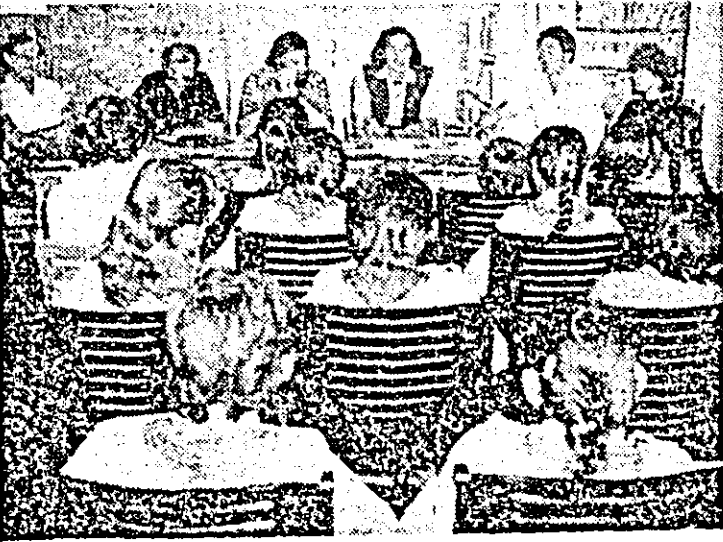
Aspect de la întîlnirea scriitorilor cu pionierii la Nădlac.