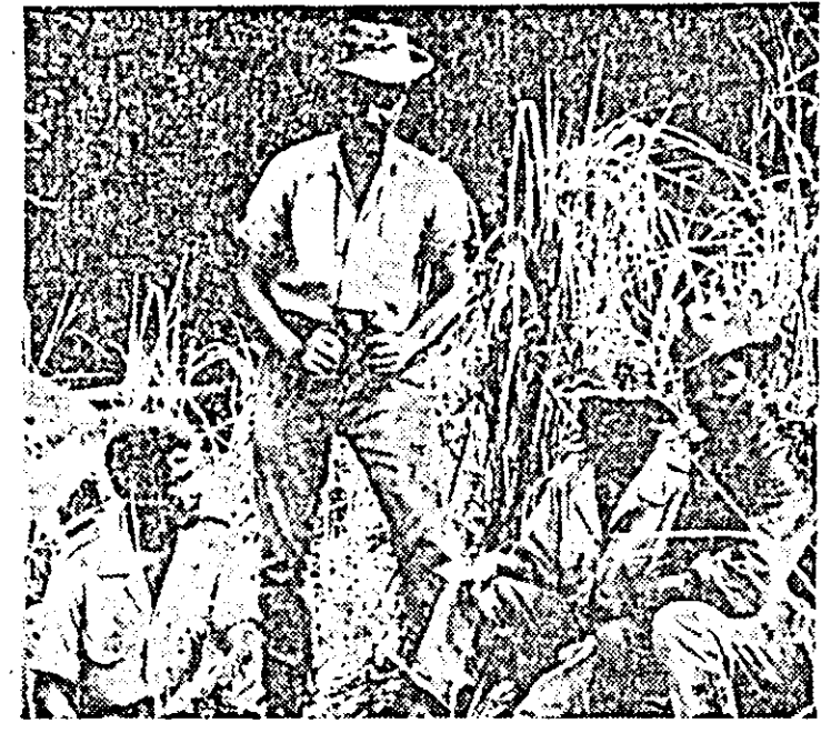
ANGOLA. Anul acesta se împlinesc 5 ani de cînd a început lupta armată a poporului Angolei împotriva colonialiștilor portughezi. În ultimul timp a crescut considerabil activitatea detașamentelor de partizani, care luptă în special în regiunea Cabinda și în nordul Angolei, în CLISEU: Un grup de partizani al partidului Mișcarea populară pentru eliberarea Angolei, în Cabinda.

HAVANA 24 (Agerpres). — Agenția Prensa Latina a dat publicității o declarație a Ministerului Forțelor Armate Revoluționare din Cuba în care se anunță că la 21 mai de la baza maritimă militară americană Guantanamo a fost comisă o nouă provocare împotriva Cubei. În declarație se arată că dintr-un camion militar american a fost deschis focul asupra unui post cubanez de grăniceri. Un soldat cubanez a fost ucis. La cîteva ore după acest incident, un post american situat la 4,5 km sud de intrarea în baza Guantanamo a deschis focul asupra unui alt post cubanez de grăniceri.