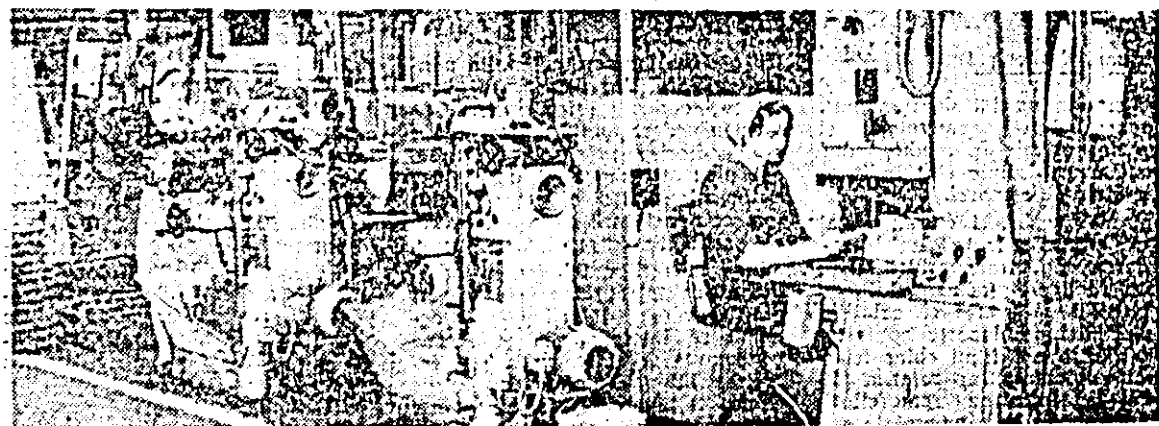
În împlinirea zilei de 23 August colectivul de muncă de la I.A.M.M.B.A. obține noi succese în producție. În foto: secvență de muncă în atelierul de prelucrări mecanice.