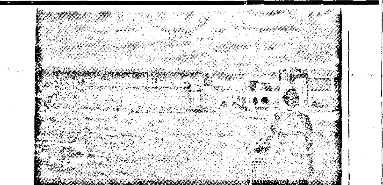
Vor kurzem noch Wüste — heute italienisches Kolonistendorf Die 20.000 italienischen Bauern, die nach Libyen entsandt wurden, um dort die Kolonisationsarbeit aufzunehmen, finden in Uras Noua Heimit fertige Wohnungen vor, so daß sie gleich mit ihrer Arbeit beginnen können. Unser Bild zeigt einen Teil des Kolonistendorfes Bianchi, das auf einem bisher völlig verödeten Landstrich errichtet wurde.