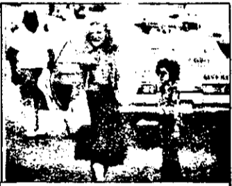
Vineri SAT 1 21,15 Gloria - film acțiune SUA

15,15 Teletext, prezentarea programului; meteo 15,25 Magazin Dunărea-Alpi-Adriatică 15,55 Concursuri școlare 16,45 Desene animate 17,15 Victoria Occidentului - India - documentar 18,05 Ar pua fi primate - reportaj