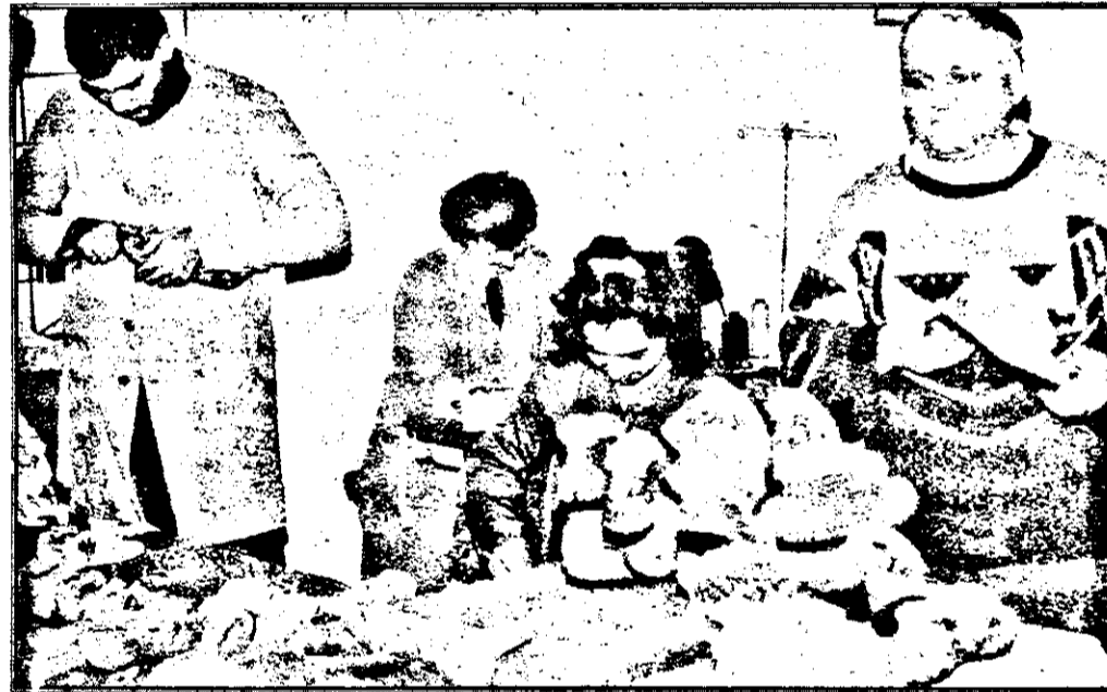
Aspect din interiorul atelierului meșterului Ciotea.

- Cei ce ne-am orientat pe producție o ducem foarte greu. Din cauza dobânzilor mari, nu putem lua credite de la bancă. Eu am cumpărat această casă pe banii mei, am plătit pentru utilaje - două mașini de cusut piele, o mașină de stantat, banc de lucru, calapoade - tot din buzunar. Dacă aș lua bani de la bancă, la asemenea dobânzi aș da faliment! Guvernul ar putea ca măcar pentru banii pe care îi plătesc ucenicilor să nu mă impoziteze, sau