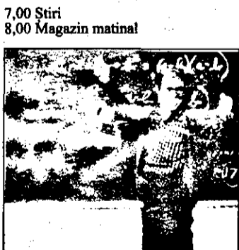
14,10 Arată-mi cine ești-Film SUA, 1987, cu Andy Garcia.

10,00 Ironside - serial polițist american 11,00 Bogați și frumoși - serial american 11,30: „227” serial american 12,00 Concursuri tv 13,00 Știri 13,30 Springfield story - serial american 14,20 Clanul din California - serial american 15,10 Vremea dorinței - serial american 16,00 Ilona Christen talkshow 17,00 Hans Meiser talkshow 18,00 Cine este șeful? - serial american