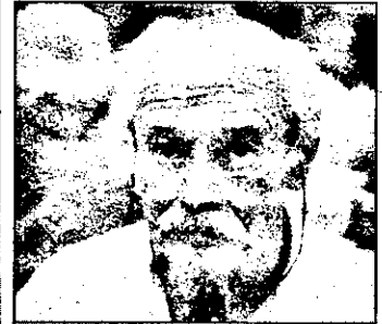
RTL2 - 21,15 Dad - film SUA 1989

12,00 Asadar - emisiune politică 12,55 Cîlînde de Crăciun - Franța 13,05 Zoff 13,30 Pe urmele Atotputernicului - documentar 14,00 Black Beauty - serial canadian 14,30 Cei șapte magnifici - western SUA, 1960 cu Steve Mc Queen, Charles Bronson, Yul Brynner 16,40 Prizonierul maharajului - film aventuri Germania, 1953 cu Richard Chamberlain 18,40 Baywatch - serial acțiune