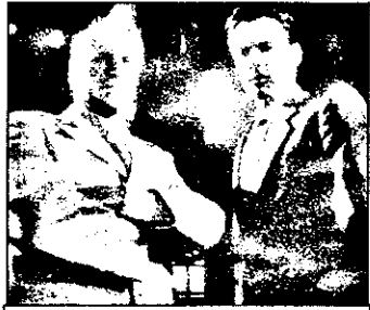
PRO7- 21,15 Proiectul „Manhattan” - film acțiune SUA 1989

7,35 Magazinul satului 8,20 Desene animate 8,45 Mesajul Bibliei 8,55 Magazinul informativ pentru tineri 9,20 Hallo, duminică! - magazin distractiv 12,00 Liturghie greco-catolică 13,00 Stiri, teletext 13,05 Jurnal cultural - Arbore genealogic; Anii barocului - documentar - Istoria securității maghiare - documentar 14,45 Muzică 15,05 Cartea junglei - documentar german - „Primejdii nevăzute” 15,25 Slujbă religioasă 15,40 Telesport - volei 17,20 Religie ortodoxă 17,47 Pogrom Walt Disney: desene animate - serial american; desene animate 19,30 Roata norocului 20,00 Săptămâna - magazin politic 21,00 Telegazeta 21,20 Anotimpuri capricioase -