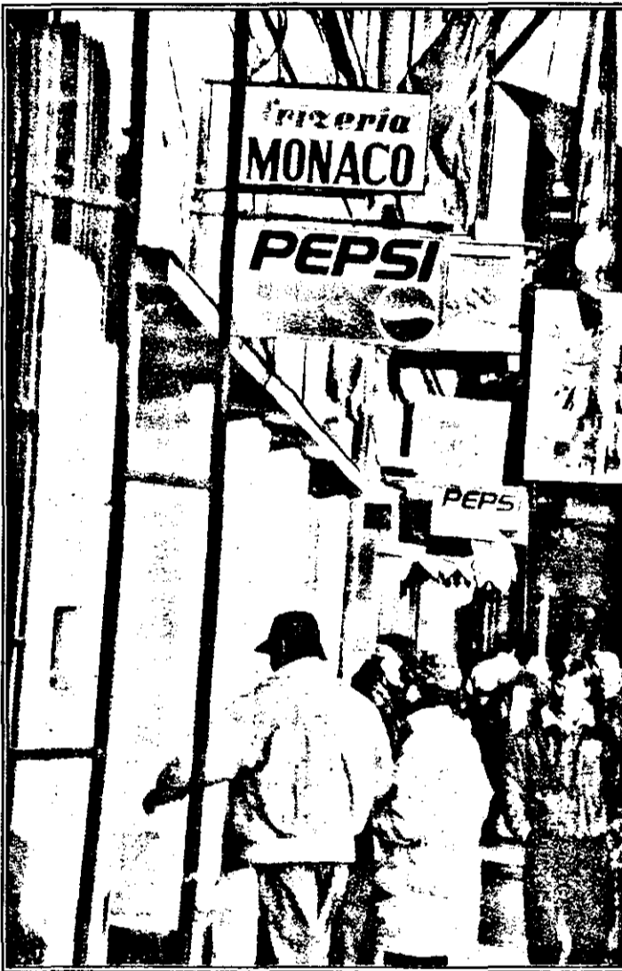
Peisaj urban cu firme