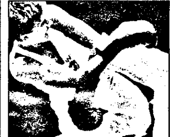
Bp.2 - 20,30 Kick box - Full contact

9,30 Aerobic 10,00 Hipism - Cupa Pieței Comune 11,00 Schi alpin CM 13,0 Motociclism - Supercros în sală 14,00 Honda - motosport magazin 15,00 Handbal - CM femei, Norvegia 16,30 Tenis - turneu feminin 18,00 Eurofun magazin 18,30 Schi alpin CM - rezumat