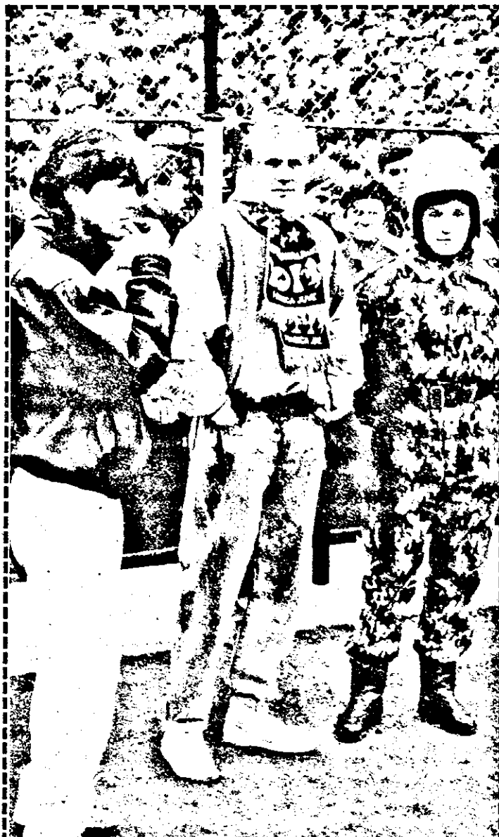
Deocamdată accidentați, Plisca și Papp așteaptă cu nerăbdare revenirea în „unsprezecele” textilist.