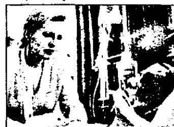
RTL - 22,15 Secretul zborului 1501 - film SUA 1990

17,00 Teletext, prezentarea programului, meteo 17,10 Dusty - serial Australia XII/3