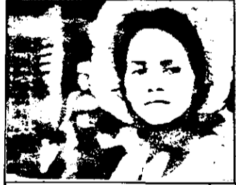
21,15 Queen - serial american III/2

16,40 Star Trek - serial american 17,45 Concursuri tv 19,00 Jurnal regional 19,30: 5x5 - concurs 20,00 Știri: sport 20,30 Roata norocului - concurs 21,15 Queen - serial american III/2 - După desființarea sclaviei, mulțura Queen își părăsește stăpânul, luându-și soarta în propriile mâini. Însă negrii nu o primesc, pentru că are pielea prea albă, iar albi... 22,05 Capitanul din Saint Pauli - film Germania, 1971 0,45 Bufnița și pisicuța - comedie SUA, 1969 cu George Segal și Barbara Streisand. Doris și Felix locuiesc în chirie în același imobil. El este contabil și scrie în timpul liber romane. Ea visează să ajungă actriță.