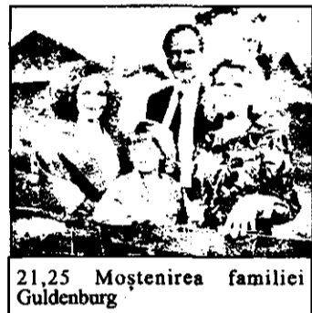
21,25 Moștenirea familiei Guldenburg

7,00 Magazin matinal 10,00 Vecinii - reluare 10,35 Trapper John M.D. - reluare 11,25 Bonanza - reluare 12,15 Teleconcursuri 13,25 Tânăr și fără odihnă - serial american: „Urmă trecătoare” 14,15 Trapper John M.D. - serial american: „Supravegherea spitalului” 15,10 Vecinii - serial american 15,40 Bonanza - serial western american 16,40 Star Trek - serial american 17,45 Concursuri tv 20,00 Știri - sport 20,30 Roata norocului 21,15 Parada șlagărelor 22,00 K - magazin criminalistic 22,55 Ulrich Mayer show 0,00 Der Spiegel TV - magazin 0,40 Electric Blue - serial erotic 1,20 Mann - O - Mann