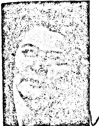
Dna ANA PAUKER, Ministrul Afacerilor Străine