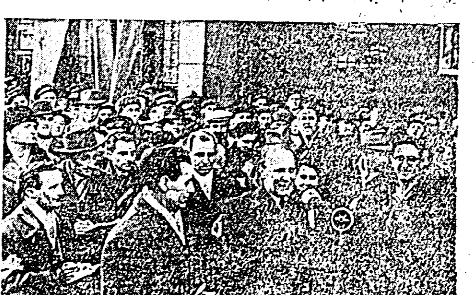
O insuflețită horă s-a lănat la mitingul din Timișoara.