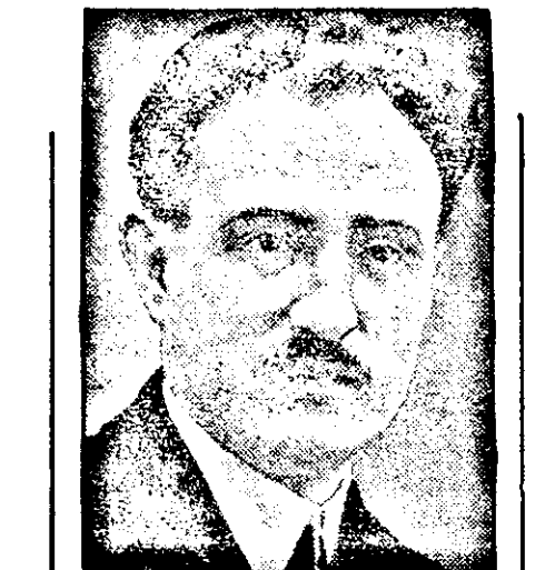
Der mehrmalige Innenminister Chau-temps wurde vom französischen Staatsprä-sidenten mit der Kabinettsbildung betraut und hat sein Kabinett zusammengestellt.