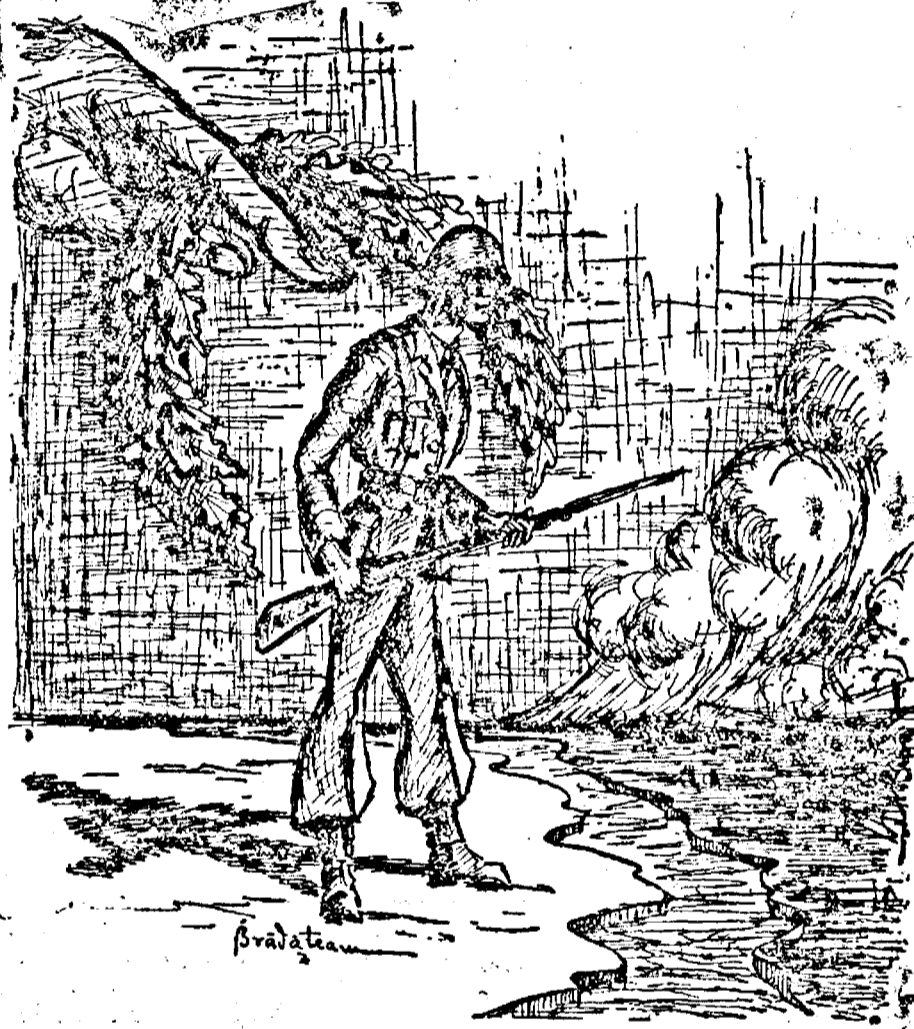
INCUNUNAȚI OPERA SOLDATULUI ROMAN SUBSCRIND LA

Răspunsul nostru la acest apel trebuie să fie subscrierea la imprumutul reîntregirii, a economiilor noastre.