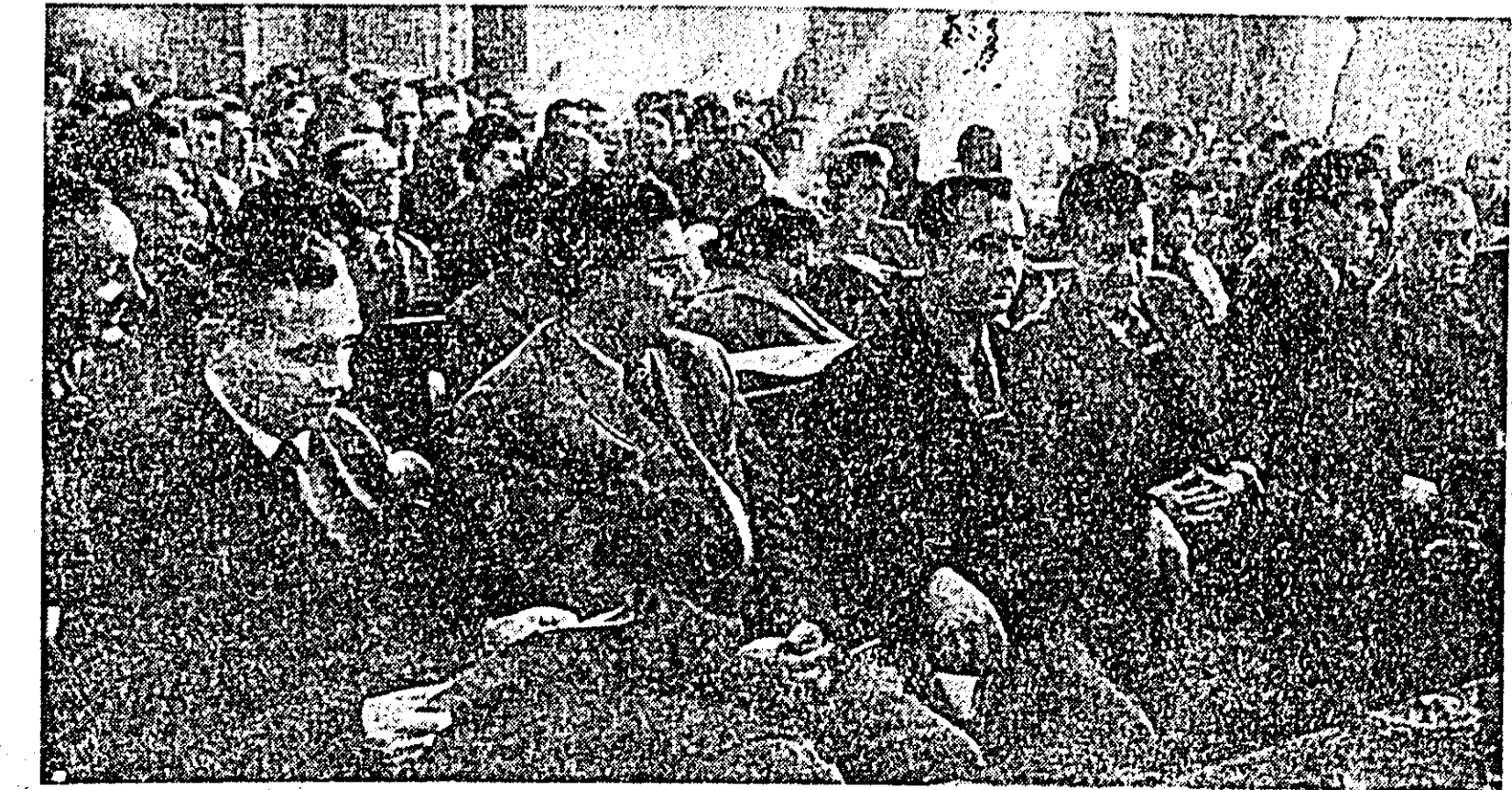
Aspect de la sesiunea Sfatului popular orașenesc.

rașului trebuie combătute cu toată lăria. În aprilie va fi organizată luna curățeniei. Sesiunea a arătat, prin hotărârea adoptată în acest sens, că toate conducerea întreprinderilor și instituțiilor, organizațiile cooperatiste, au datoria să ia măsuri din timp pentru executarea lucrărilor de înfrumusețare și de păstrarea curățeniei în interiorul și exteriorul edificiilor. Fiecare cetățean are datoria să organizeze și să ia parte la văruierea fațadelor clădirilor, repararea șanțurilor, a podurilor și podelelor, a tot ce poate duce înspre mai frumos, mai curat.