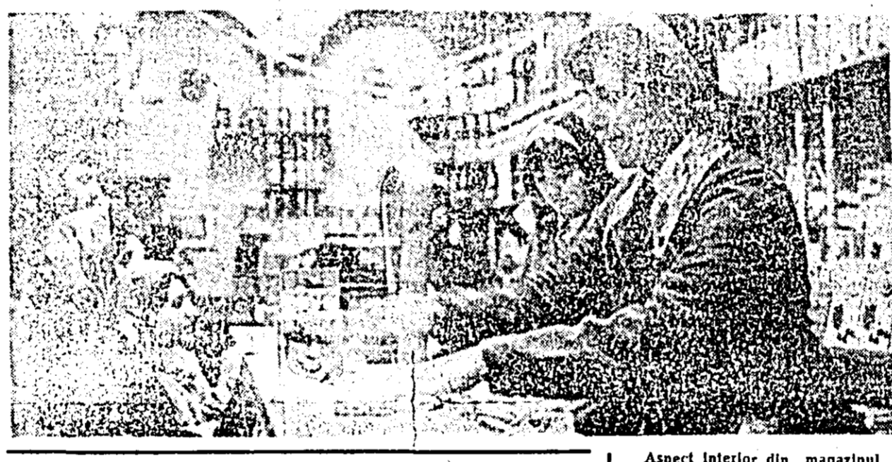
Aspect interior din magazin alimentar „Moca” și căruț colectiv se evidențiază prin o deservire corespunzătoare a cumpărătorilor, prin rezultatele bune obținute.