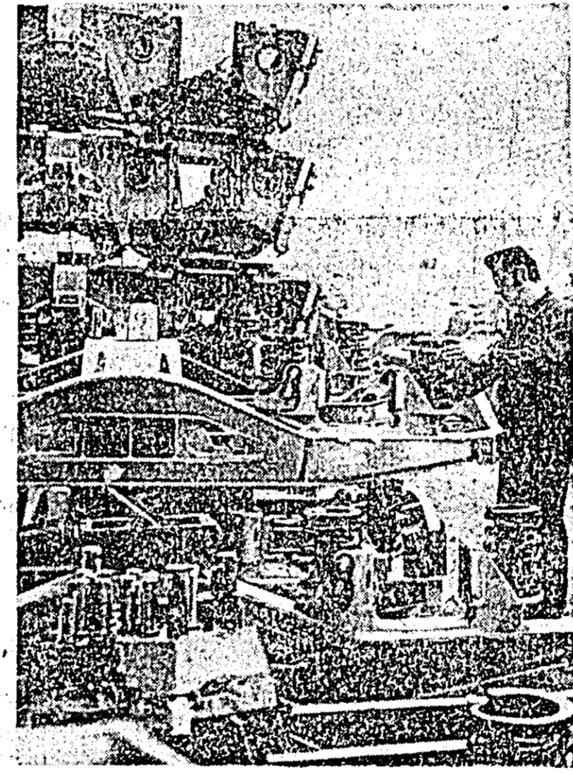
Convorbire consemnată de T. PETRUȚI

ÎN PAGINA a II-A ATENEU — ARTĂ, CULTURĂ, ȘTIINȚĂ