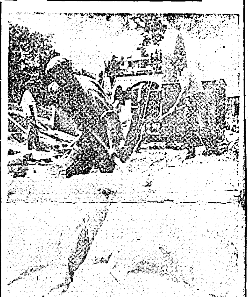
R.P. UNGARA. În regiunea Szabolcs-Szatmar, cea mai cruntă lovitură de năvala apelor dezlănțuite, acum după retragerea lor, se desfășoară o rodnică muncă de reconstrucție. ÎN FOTO: pregătirea mortarului cu ciment donat de România.

vele consecințe economice pe care le are războiul purtat de regimul lui Lon Nol, sprijinit de forțele americano-saigoneze, împotriva forțelor patriotice, se spune în mesaj. Pe de altă parte, mesajul menționează că, în afara dificultăților economice, populația khmeră este supusă unui regim de opresiune politică. În acest sens, este condamnată noua măsură repressivă a autorităților de la Pnom Penh, instituirea legii marțiale — în virtutea căreia orice cetățean poate fi condamnat pe termene de la 5 la 20 de ani, fără un motiv întemeiat. Șeful statului cambodgian arată, totodată, în mesaj, posibilitățile de dezvoltare a unei vieți libere în zonele aflate sub controlul forțelor de rezistență populară.