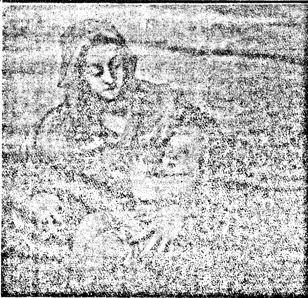
TINTORETTO: „Fecioara cu pruncul“ (detaliu).