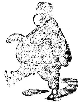
s'a Ingrășat de 120 Klgr.