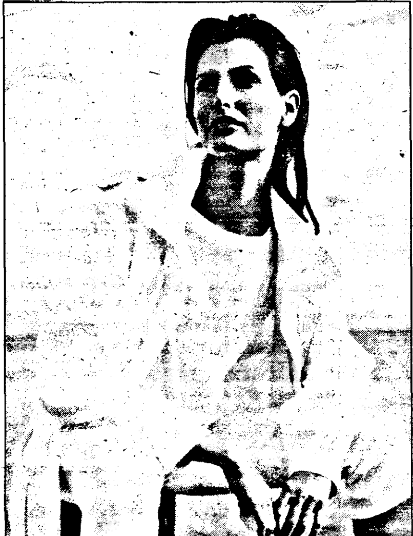
Grăsimea de pe pielea mâinii și aerul concură la întunecarea nuanței.

in această lumină, veți arăta minunat oriunde. Când terminați tubul de rimel, nu aruncați pensula. Spălați-o de fard și veți avea o perie pe care o puteți folosi la periajul genelor pentru a îndepărta excesul de rimel și a obține „gene întoarse”. Amenajați-vă o cutie pentru farduri în frigider. Lacul de unghii își menține mai mult timp fluiditatea iar parfumul calitățile dacă le veți ține la temperaturi mai joase. De asemenea, cremele se mențin mai mult timp proaspete în acest loc răcoros. Spălați săptămânal cu săpun, de preferință antibacterian pensulele folosite la machiaj.