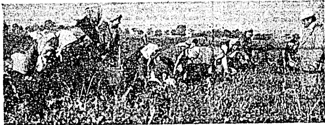
Se culege ardelul la Stațiunea de cercetare și producție de legume din Aradul Nou.

Locuitorii meleagurilor arădene dau viață Chemării celui de-al doilea Congres al consiliilor populare • În tabăra de sculptură Căsoala: Periplu pe cercul virstelor spirituale • Sport • Note... note • Viața de partid • Mica publicitate.