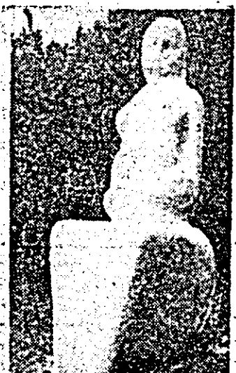
Din creațiile taberei de sculptură de la Căsoaia.