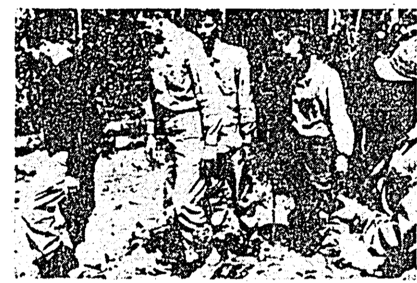
Un document grăitor — un grup de militari americani, luați prizonieri de forțele patriotice.

presura Saigonul de forțele patriotice, avioane americane de tip „B-52” au bombardat în rețetate rânduri diferite puncte din provinciile Binh Duong și Hau Nghia. Agențiile de presă nu menționează dacă raidurile bombardierelor americane au atins vreun obiectiv.