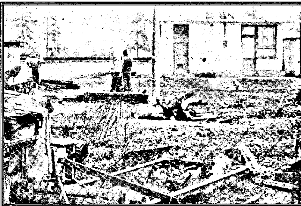
Oferta depozitului de combustibil solid de lângă gara Chişineu Criş depășește... orice imaginație.

prins-o iarna cu depozitele arhipline. Deși computurile sunt deosebit de gustoase, eventualii beneficiari nu prea le caută. De ce? Ei bine, probabil pentru că nu au aspect comercial. Pe piață poți vedea orice, numai produse de „Arlefruct”... nu. Există, totuși, o explicație pentru această stare a lucrurilor. Dacă cei ce se ocupă cu aspectul produselor ar investi în etichete și borcane mai arătoase, prețul borșului, al gemului, al tocăniței de fasole sau al magiunului ar fi mai ridicat decât chiar produsul în sine. Să sperăm însă că pe viitor se vor schimba, cât de cât, lucrurile. Lumea nu are de unde să știe