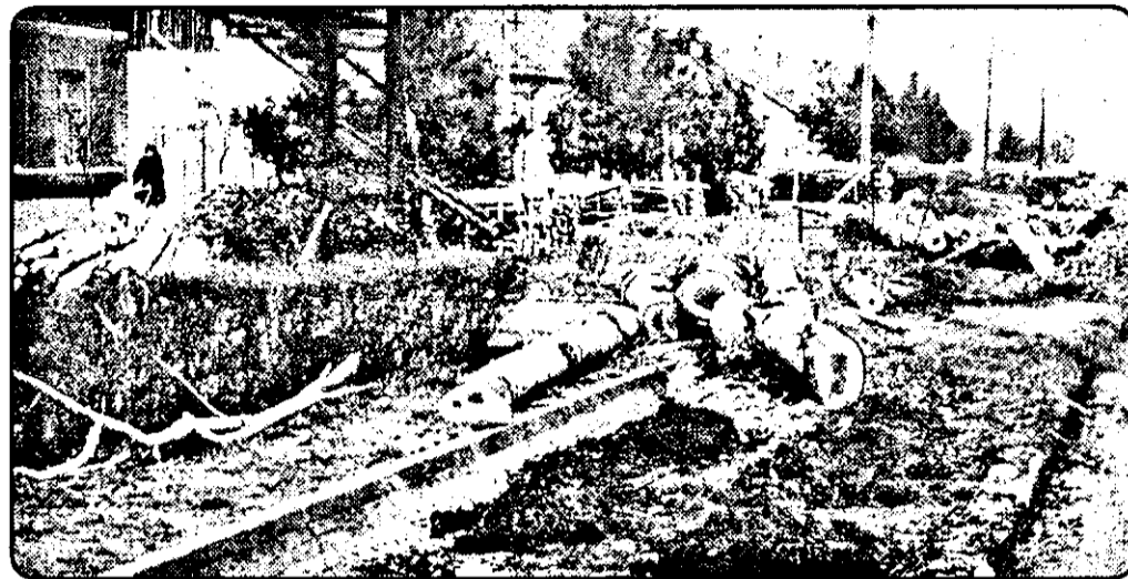
Pe strada principală din Chişineu-Criş s-au tăiat toţi copacii. Se pare că deranjau cablurile...

Iată însă că anumite lucruri nu stau tocmai „ca la carte”. Dar nu din vina localnicilor, desigur.