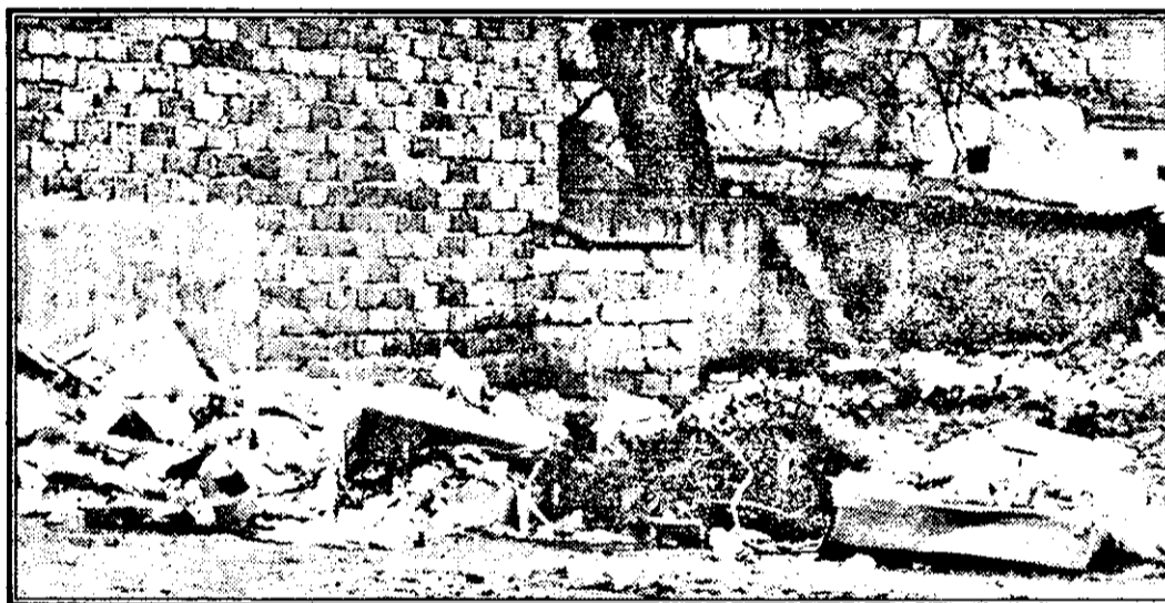
Uneori, rampa de gunoi servește doar cu punct de reper pentru... zona în care trebuie aruncate gunoaietele.