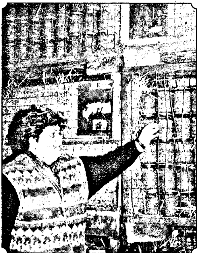
Beneficiarii cam ocolesc produsele Arlefruct-ului. De ce? Bună întrebare!

prins-o iarna cu depozitele arhipline. Deși computurile sunt deosebit de gustoase, eventualii beneficiari nu prea le caută. De ce? Ei bine, probabil pentru că nu au aspect comercial. Pe piață poți vedea orice, numai produse de „Arlefruct”... nu. Există, totuși, o explicație pentru această stare a lucrurilor. Dacă cei ce se ocupă cu aspectul produselor ar investi în etichete și borcane mai arătoase, prețul borșului, al gemului, al tocăniței de fasole sau al magiunului ar fi mai ridicat decât chiar produsul în sine. Să sperăm însă că pe viitor se vor schimba, cât de cât, lucrurile. Lumea nu are de unde să știe