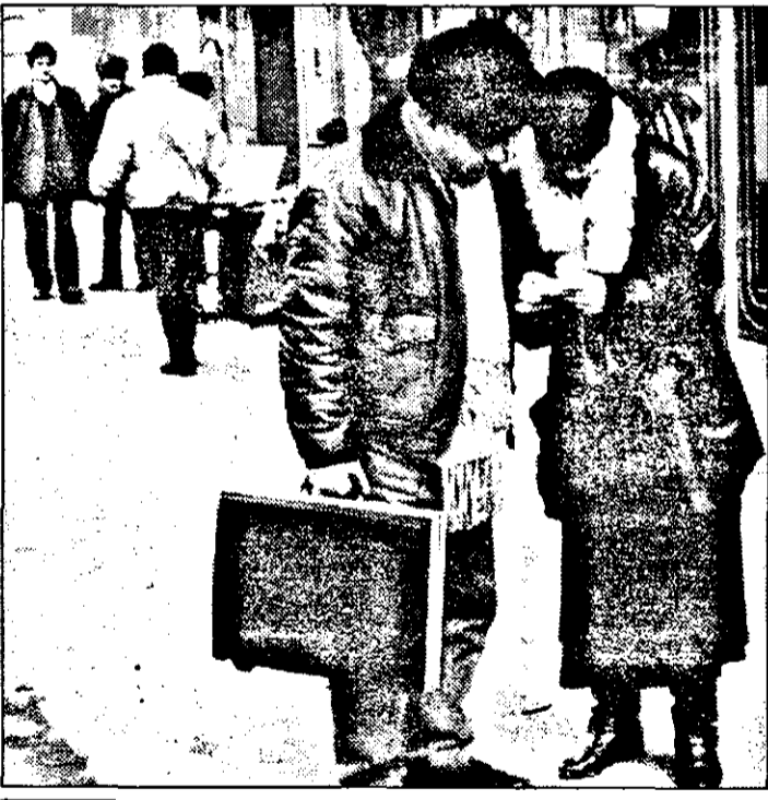
„27... 31... 25... BINGO!