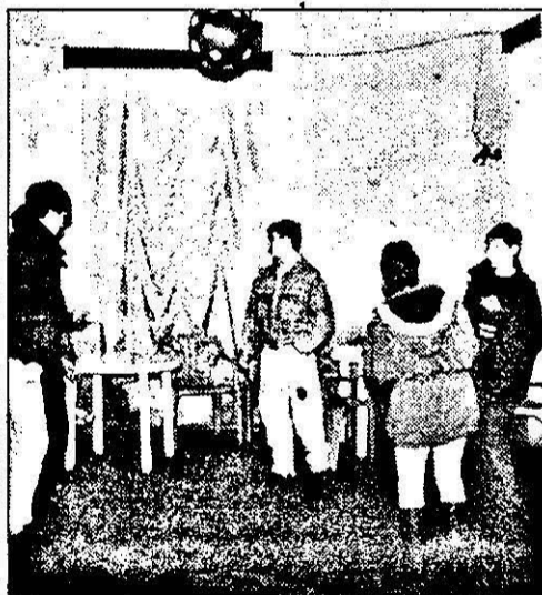
Tineri care au dreptul la un loc de petrecere a timpului liber sunt obligați să-și suporte și pe cei al căror cap este „condus” de aburii alcoolului.

Puține și greu de înțeles sunt școlile unde se organizează discotecă. Chiar dacă aceste discotecă stau sub „mască” de Club sportiv „Eagles”. Înainte de Crăciun, printr-o decizie a Primăriei Fântânele, s-a atribuit fosta sală de clasă Clubului sportiv „Eagles” pentru a se organiza discotecă. Aceasta a fost inaugurată în seara Ajunului de Crăciun. Din păcate, imediat după deschidere, o serie de fapte mai puțin obișnuite au lăsat un gust amar, atât locuitorilor din Fântânele, cât și autorităților. Fapt ce a dus renumele discotecii din Fântânele până în municipiul nostru. Alte locuri de distracție nu sunt, cele trei baruri neputând acoperi numărul mare de tineri ce sunt obligați în week-end să stea acasă sau să vină la discotecă.