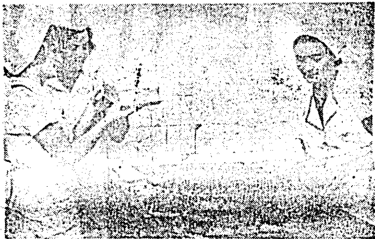
Cofetăria „Libelula”. Unitate apreciată aici pentru produsele de o largă diversitate — multe dintre ele adevărate unicate în materie — dar și pentru ambianța plăcută, amabilitatea și servirea ireproșabilă pe care consumatorului le găsește aici. În clipșu: aspect din laboratorul cofetăriei.