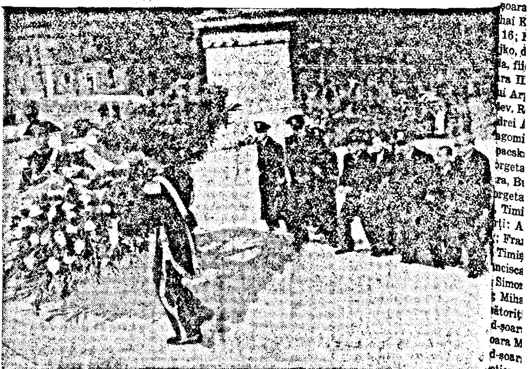
LA ROMA: D. Matsuoka, ministrul de externe al Japoniei, la morțuarul soldatului necunoscut.