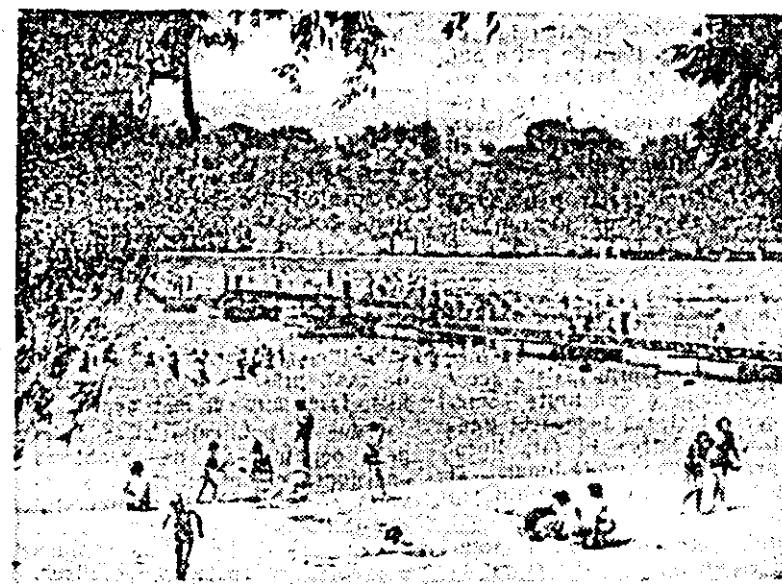
În aceste zile călduroase de Iulie, frumosul strand arădean este „asaltat” de mii de arădeni care găsesc aici o reconfortantă oază de... răcoare.

COMPONENTA NOMINALĂ A ACESTOR COMISII URMEAZĂ SĂ FIE COMUNICATĂ DE CĂTRE UNITĂȚI LA DIRECȚIA CENTRULUI PROBLEME DE MUNCA ȘI OCROTIRI SOCIALE A JUDEȚULUI ARAD, pînă cel tîrziu la data de 28 IULIE A.C., în vederea organizării instruirii acestora, așa cum s-a cerut prin adresă nr. 31.080 din 1977.