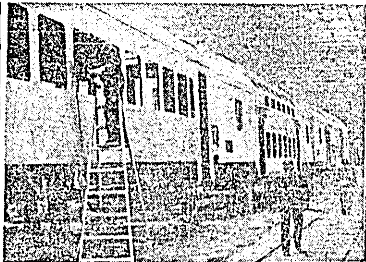
Aspect de muncă în secția montaj a întreprinderii de vagoane Arad.