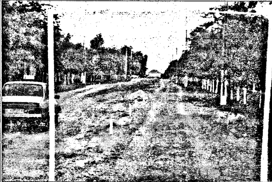
La Șimand, drumurile sunt împărțite în două: pe partea amenajată pot circula cei care au contribuit cu bani la repararea lor, pe cealaltă restul, introducerea noul taxă va schimba regula...