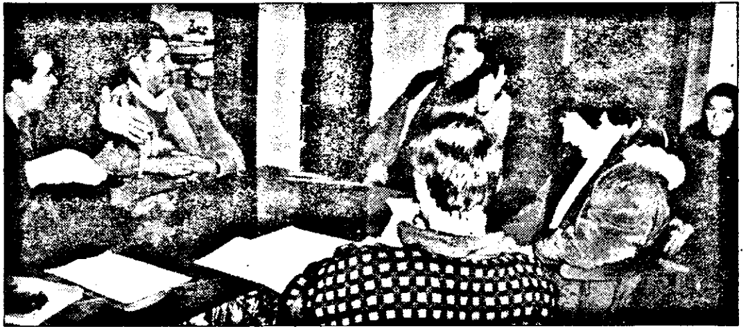
...aprobarea și adoptarea... în cadrul... în... în...