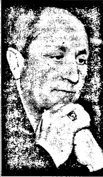
Ultimele Sărbători Fără... determinat pe viceprimarul Moroșteș să îngroape securea războiului.