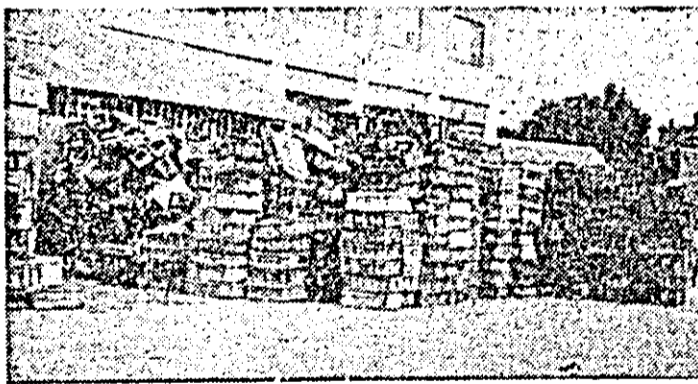
La unitatea nr. 9, sute de lădițe, depozitate în stradă, așteaptă să fie ridicate de I.C.R.A.