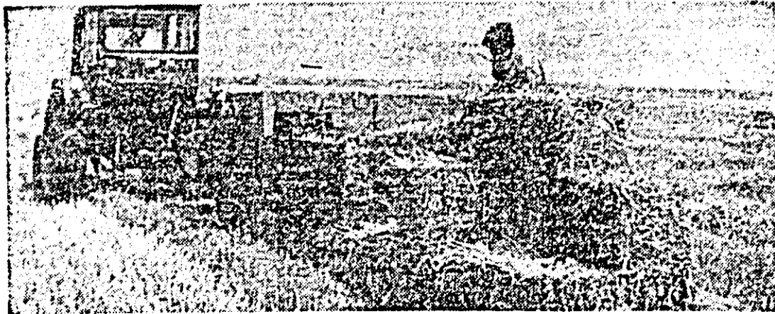
Și pe ogoarele C.A.P. Zăbrani continuă intens balotatul paielor și eliberatul terenului