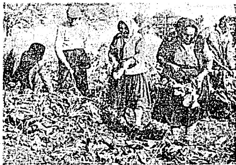
Cooperatorii din Șimand în plină activitate la recoltatul și decoletatul steclei de zahăr.