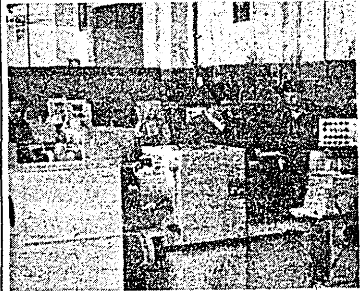
Aspect de muncă în secția montaj a Întreprinderii de mașini-unelte Arad.