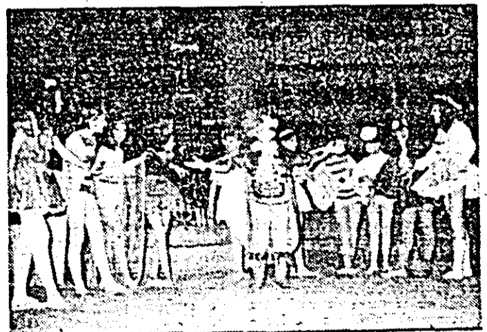
Moment din spectacolul cu feeria „Scufița Albăstră și prietenii ei”.

buția acestei feerii muzicale. Oricum, noi credem că o să-i mai revedeți cît de curînd pe scenă. De altfel, sîntem hotărîți să realizăm cu acest colectiv de mici actori și alte spectacole pentru că dorim ca și în actuala ediție a Festivalului național „Cîntarea României” să obținem aceleași rezultate frumoase și, de ce nu, chiar locul I la faza pe țară...” VASILE FILIP