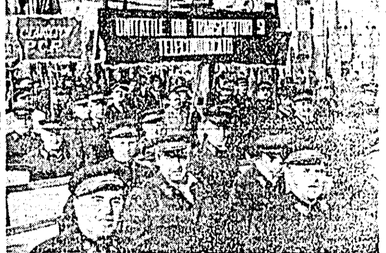
Harnicii celerități au raportat și de astă dată la marea sărbătoare că își îndeplinesc cu cinste sarcinile de plan și angajamentele asumate.