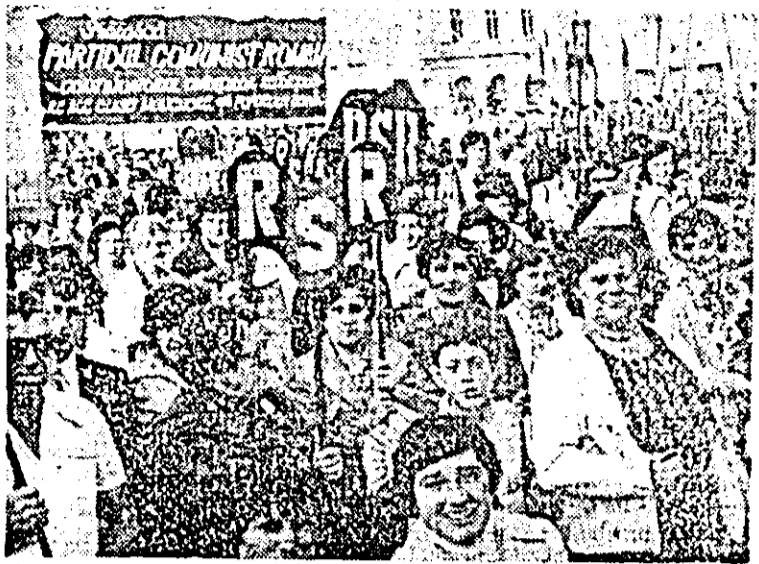
Lozinci înflăcărate slăvesc marea sărbătoare, patria socialistă, partidul — încercatul conducător, liderul tuturor victoriilor noastre.