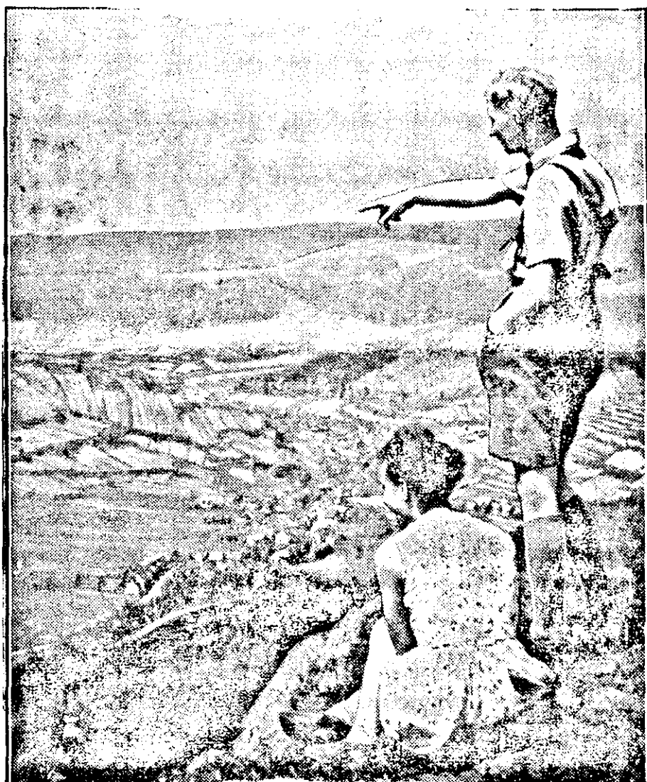
Am Ziel der Pfingstfahrt

New York. Ein angesehenes Senator hielt in Philadelphia eine Rede, in welcher er den Gedanken, daß eine europäische Macht in Amerika einmarschieren könnte, als lächerlich bezeichnete. Eine Gefahr für Amerika könnte nur von innen drohen.