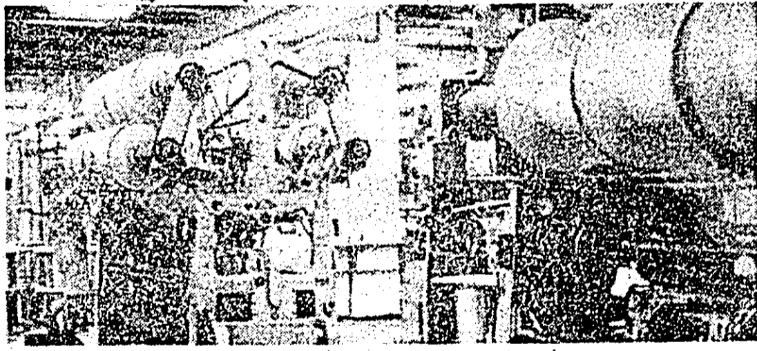
Secvență de muncă la Întreprinderea „Tricolor roșu”.

Diversitate și spirit revoluționar în temele artei ■ „Ziua pionierului” ■ De ici, de colo ■ Telegramme externe.