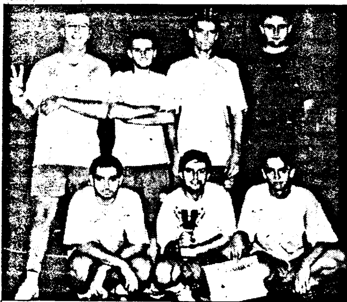
Chiar dacă au cedat în finală, băieții de la „Adevărul” au constituit surpriza celei de-a VII-a ediții a Cupei Trandafirul.