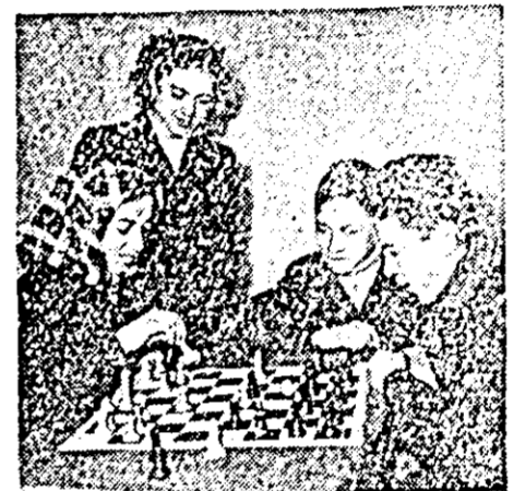
O partidă de șah e de-acum un lucru obișnuit.

satul e încă înlîștit. E ză de odihnă și aceasta se simte aici din plin. Gospodinele nu alcargă la piață după cumpărături și nici nu așteaptă laptaul. Au totul la îndemînă. Rar scrișle cumpăna unei flintini, se închide o poartă, nechează un cal, latră un cîine... Totul însă parcă se petrece după o anumită măsură.