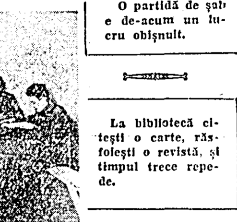
La bibliotecă cliștii o carte, răsfoiești o revistă, și timpul trece repede.