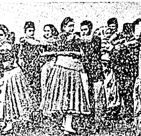
Iată că s-a încins și hora.

Cu ocazia împlinirii a 100 de ani de la apariția primului timbru, în întreaga țară au loc o serie de manifestări închinăte acestui eveniment.