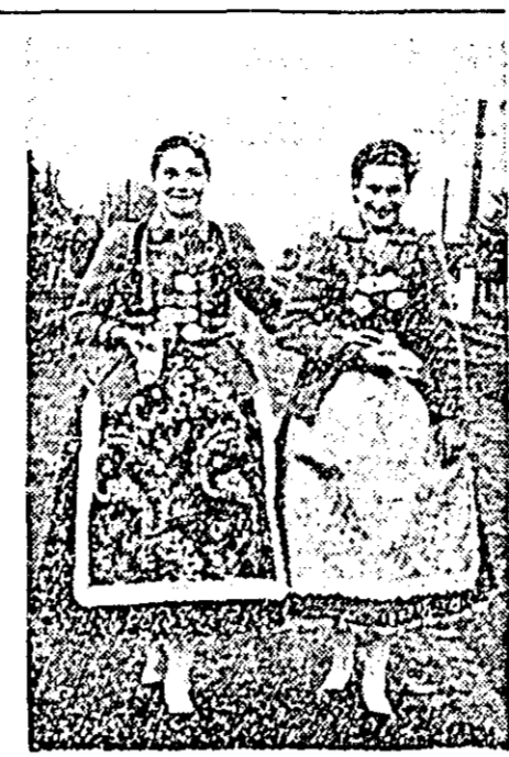
Nu-l așa că-i frumos portul la noi în sat?

Ca încheiere, un amănunt interesant: vara viitoare suprafața străzilor asfaltate din orașul nostru se va mări cu încă 30.000 metri pătrați. O cifră destul de promițătoare pentru început.