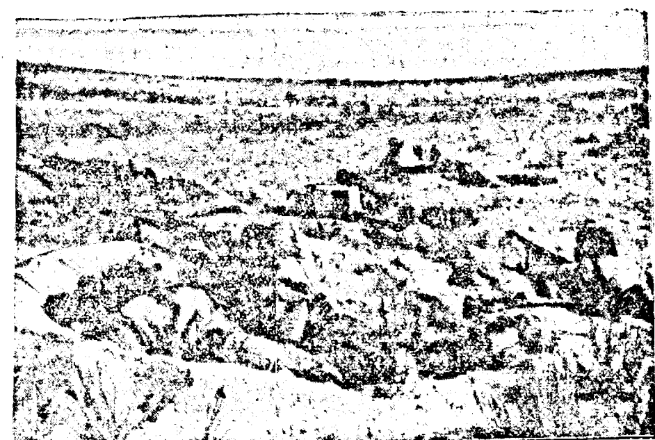
Trope indigene italiene în deșertul Africii. După cum se vede aceste trupe au o instrucție bună, folosind admirabil terenul.