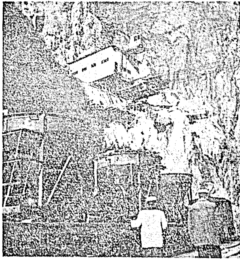
În țara noastră a fost creată și se dezvoltă o puternică bază energetică. În anul 1960 producția de energie electrică era de 7,7 miliarde kWh, adică de circa 7 ori mai mare decît în 1938. Anul acesta producția de energie electrică va fi de 11,8 miliarde kWh.

Succesele obținute în toate domeniile de activitate sînt rodul