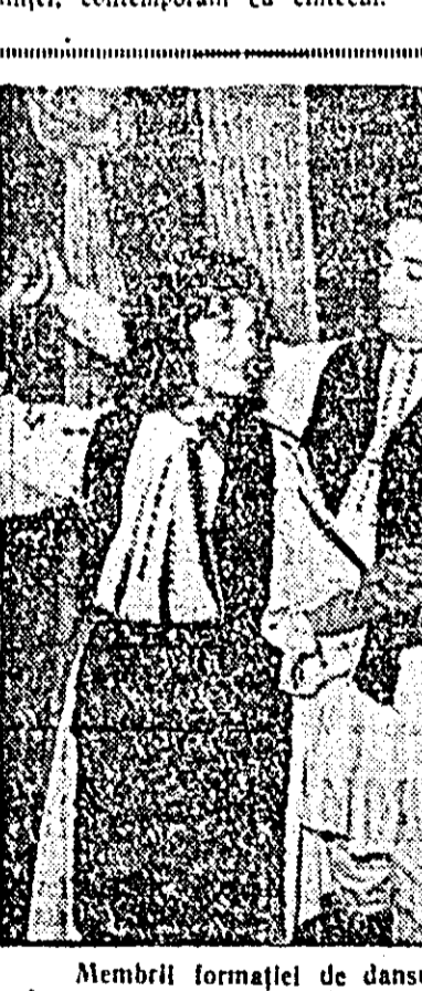
Membrii formației de dansuri de cooperativa "Precizia", se pregătesc intens pentru etapa a doua a celui de-al VII-lea concurs republican al artiștilor amatori...