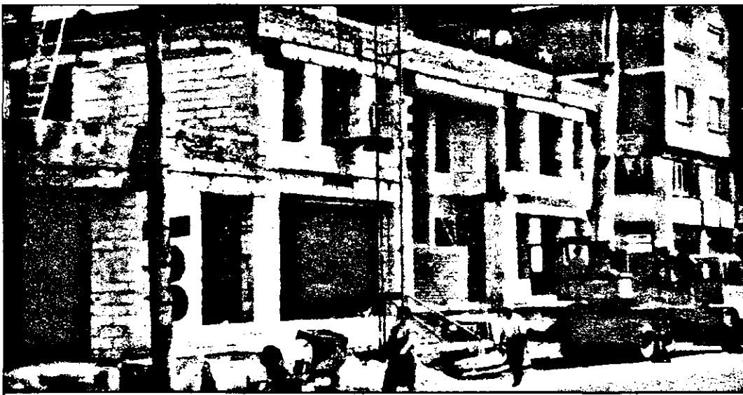
... Până când va fi terminată construcția altor bănci care „cresc” acum în zona Gării de Nord a Aradului - Banca Română pentru Dezvoltare, Banca Agricolă, Postbanc și noul sediu al Casei de Economii și Consumaționi, de unde vă prezentăm o imagine.