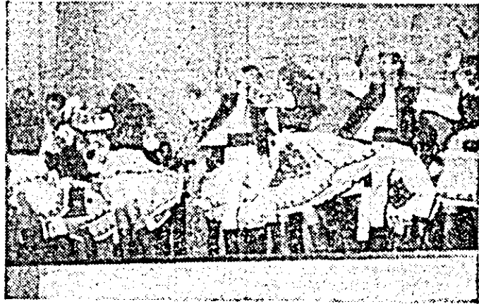
Ansamblul folcloric al sindicatului I.V.A. pe scena festivalului.