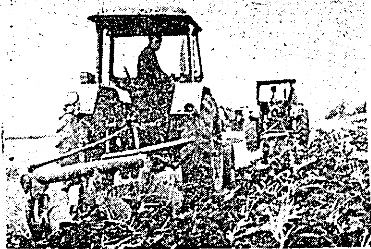
O recoltă a fost strînsă, alta se pregătește: la C.A.P. Frumuseeni, pe terenul proaspăt eliberat de paie, plugurile trag brazda celei de a doua culturii.

COMITETUL JUDEȚEAN ARAD AL P.C.R. CONSILIUL POPULAR JUDEȚEAN