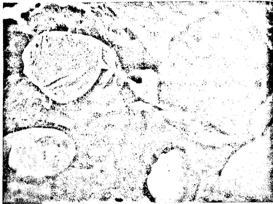
Speisung während dem Wettschwimmen

Im Zuge der bewaffneten Luftaufklärung vor der französischen Atlantik-Küste wurde ein britisches Transporterschiff von 5000—6000 Tonnen erfolgreich mit Bomben angegriffen. Weitere Aufklärungsflüge erstreckten sich auf Teile der Nordsee.