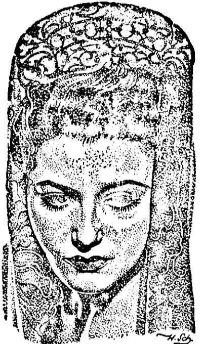
Nr. 20 Zeichnung Schatz/Terra Ein eindrucksvolles Gesicht, neu im Film, lernen wir in dem Terrafilm „Brand im Ozean“ kennen: Winnie Markus spielt eine Hauptrolle, die einzige Frau zwischen Männern, zwischen Sensationen und dramatischen Konflikten

UFA JOURNAL: Italiens Eintritt in den Krieg, Besetzung von Dünkirchen, Bombardierung der englischen Schiffe die die englische Mannschaft zurücktransportierten, Freilassung der holländischen Kriegsgefangenen, Durchbruch der französischen Front am 5. Juni, Bombardierung von Paris, Hitler an der Front.