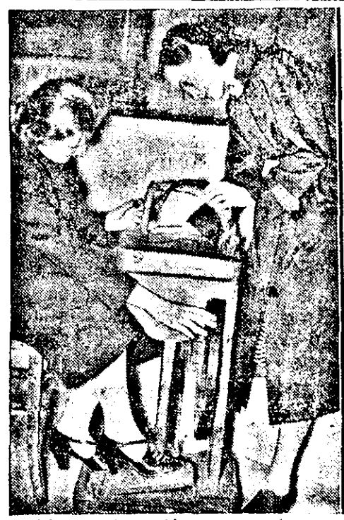
Eine Nähmaschine aus Holz und schöne bauerliche Architektur aus der Ostmark

Ackerbauminister Jonescu-Sifesti ist gestern zu einer Inspektionsreise im Banat in Lemeschburg eingetrof- fen. Am Nachmittag wohnte er der Einweihung eines neuen Pavillons des Tschanaber landwirtschaftlichen Forschungsinstitutes bei.