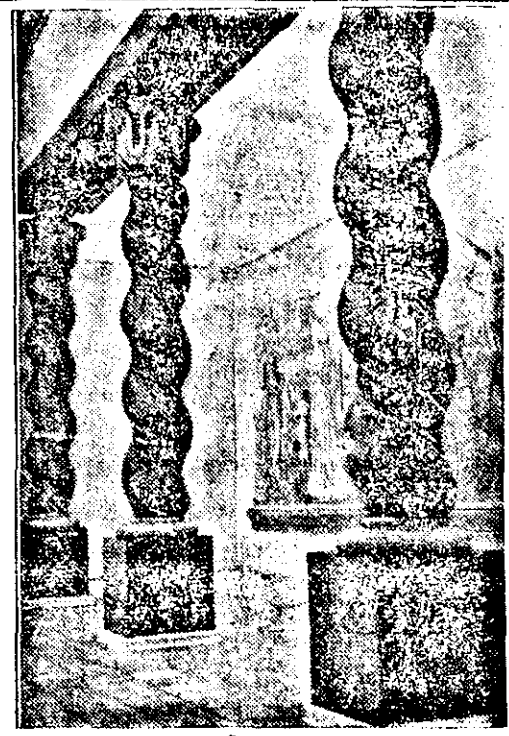
Jacob Esslenbe um das Jahr 1848 gebaute erste Nähmaschine aus Holz. Unser rechtes Bild zeigt schöne Säulen im bauerlichen Barock, die man am Eingang zur „Galle der Kultur“ erblickt.

Kürzlich wurde in Berlin die große Schau „Berge, Menschen und Wirtschaft der Ostmark“ eröffnet. Die Ausstellung zeigt viele interessante Einzelheiten. So sieht man u. a. (links) die von dem Tiroler Bauern