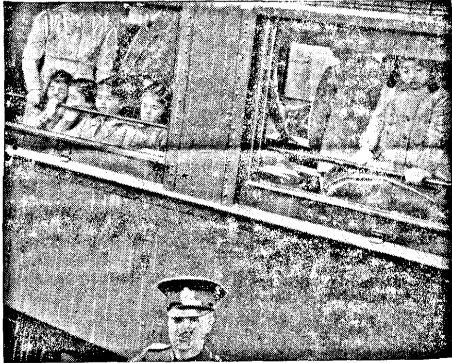
Die Fünflinge fahren mit der Eisenbahn

Als besondere Attraktion in Toronto sind noch immer die berühmten kanadischen Fünflinge. Unser Bild zeigt die Fünflinge am Fenster eines Zuges, links sieht man hier und rechts das fünfte Kind.