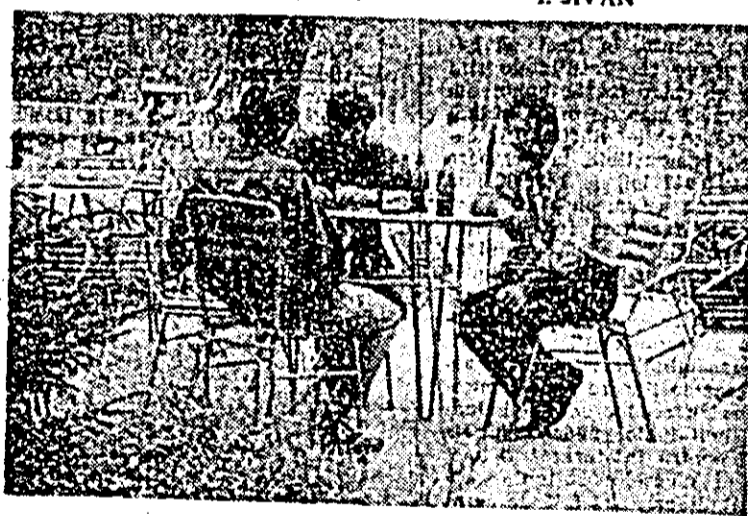
La cabana de vinătoare din pădurea Vladimirescu, luna este închis. Inchiș pentru orice vizitator în afară de... cunoscuții lucrătorilor de la cabană. În imagine: o dovadă a lipsei de... serv. în ziua cînd cabana este închisă?!