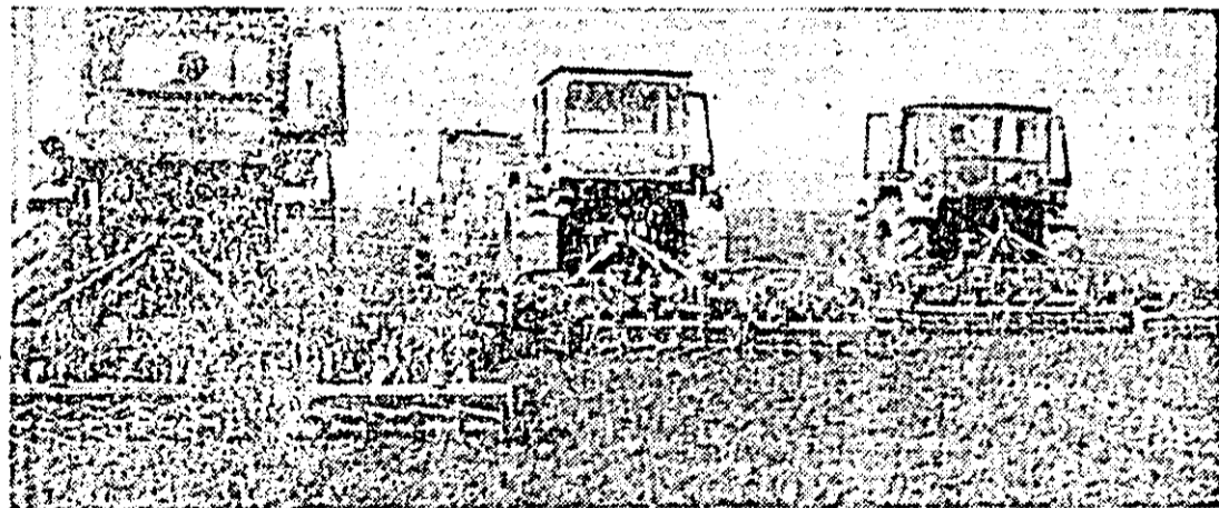
C.U.A.S.C. Fintinele. Se acționează cu forțe sporite la pregătirea terenului pentru viitoarele culturi.

În încheierea lucrărilor plenarei au luat cuvîntul tovarășa Elena Verona Burtea și tovarășa Elena Pugna.